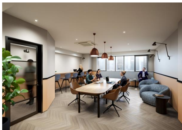
ワーキングラウンジ