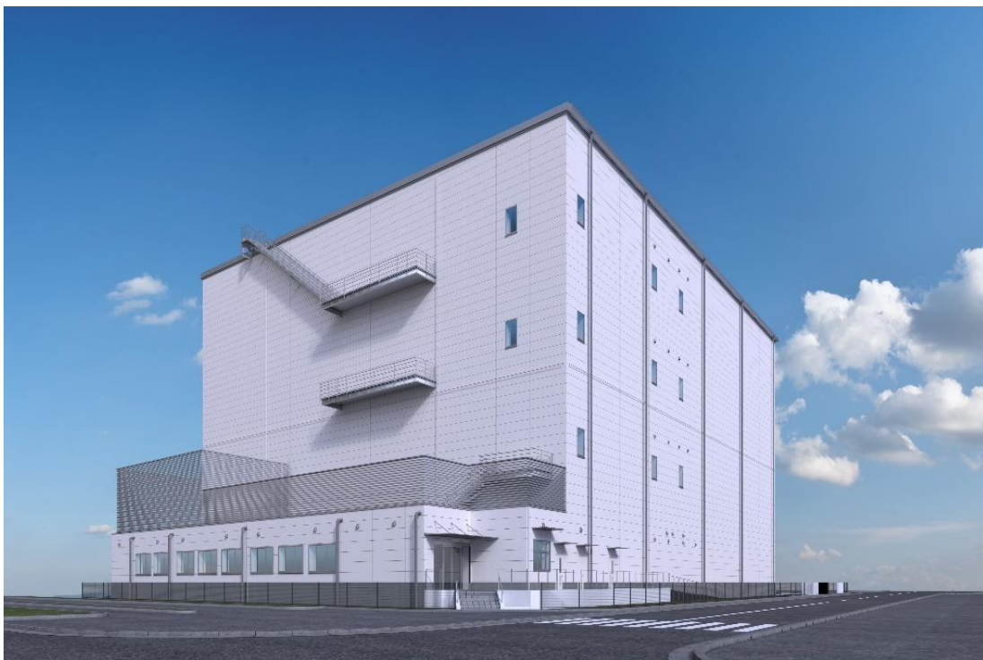
(仮称) 習志野市茜浜一丁目計画 外観イメージ