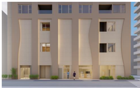
低層部外観イメージ

アースカラーを基調とした共同住宅部分は、1DKが2タイプ（約25㎡・約41㎡）となっており、計28戸を計画しております。また、スーパー銭湯は、墨田区で温浴施設「両国湯屋 江戸遊」等を運営する株式会社東新アクアが運営し、居住者・在勤者・来街者まで、老若男女幅広い方々に憩いとくつろぎの場を創出し、まちの新たな賑わいの拠点やコミュニティの場となります。