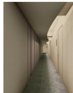
共同住宅共用廊下イメージ