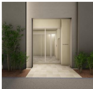
共同住宅エントランスイメージ