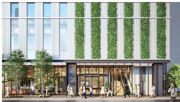
エントランス外観イメージ