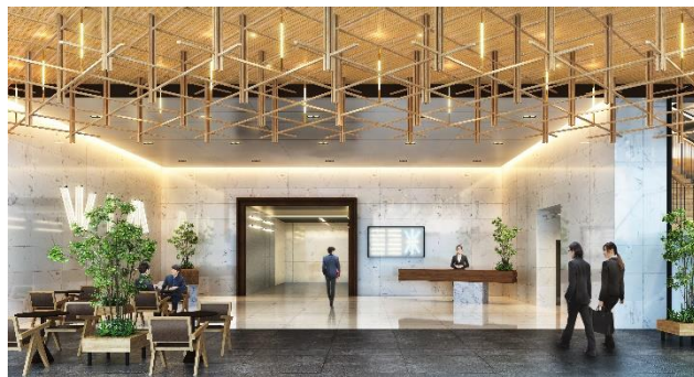
エントランス内観イメージ