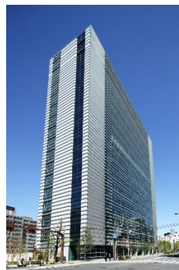
錦町トラッドスクエア